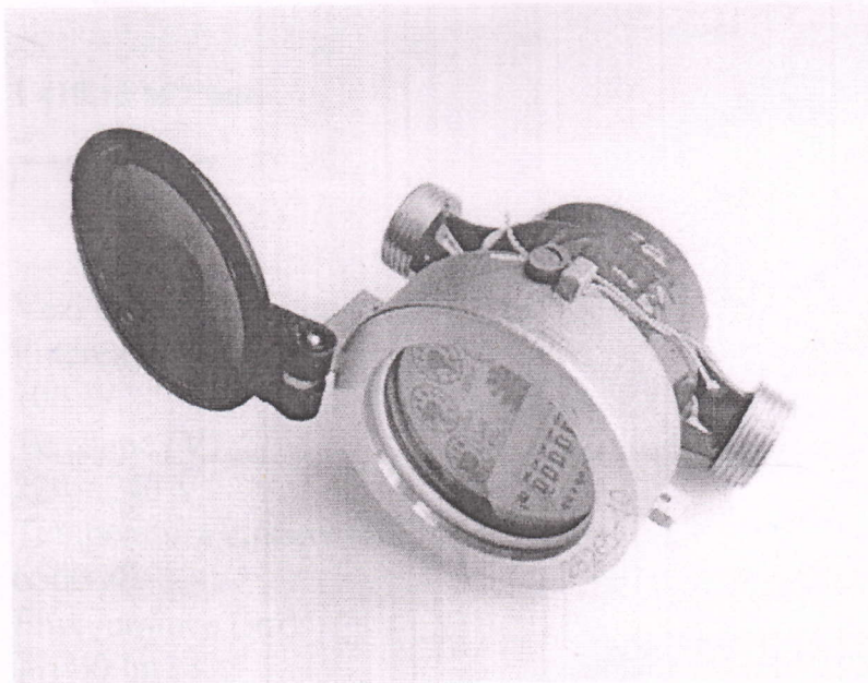
Contor de apa rece DS